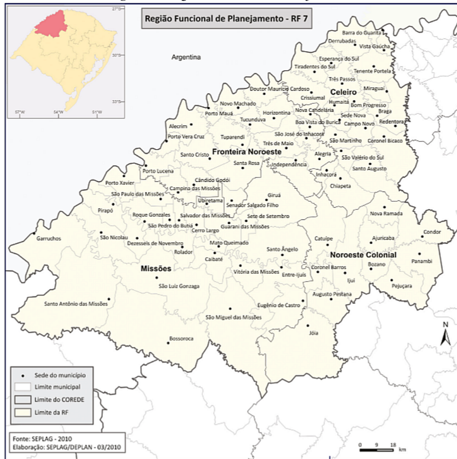
Figura 2 - Região Funcional de Planejamento 7